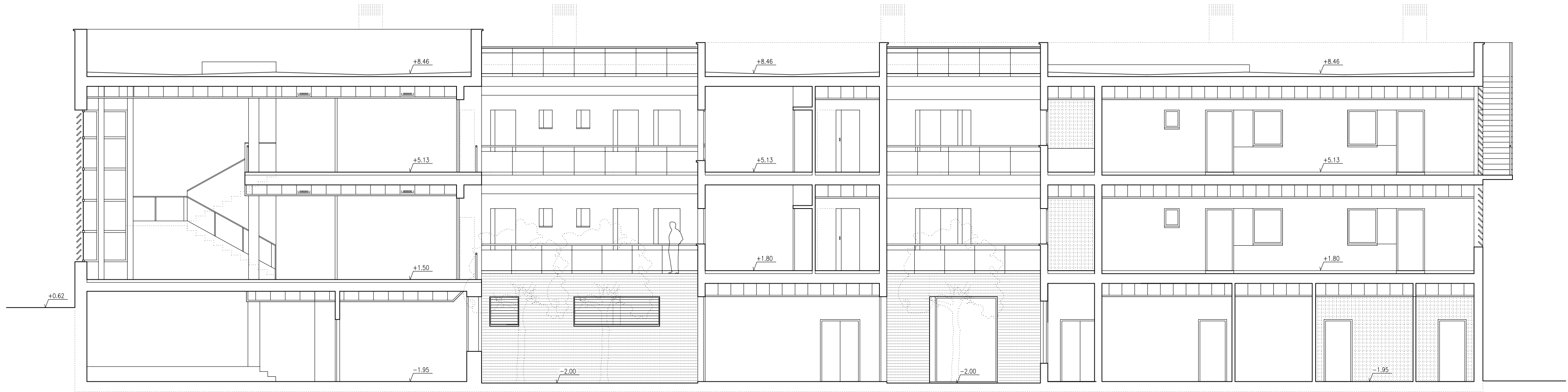
Sección longitudinal J-J'

PROYECTO BÁSICO Y DE EJECUCIÓN DE OBRAS DE ADECUACIÓN DE LOCAL PARA CENTRO DE DÍA Y OFICINAS DE SERVICIOS SOCIALES CALLE ANFITEATRO, 40 CARMONA ( Sevilla )