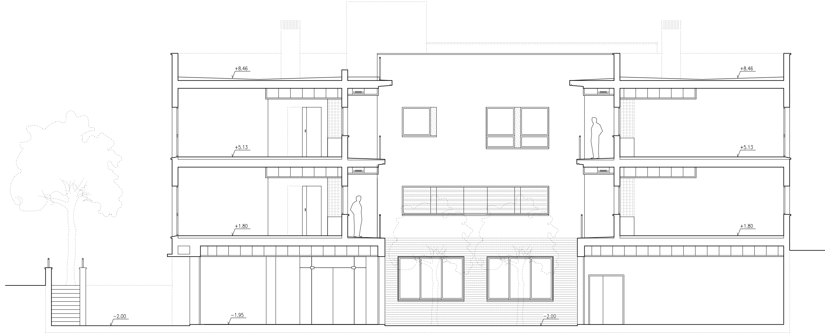
Sección longitudinal I-I'